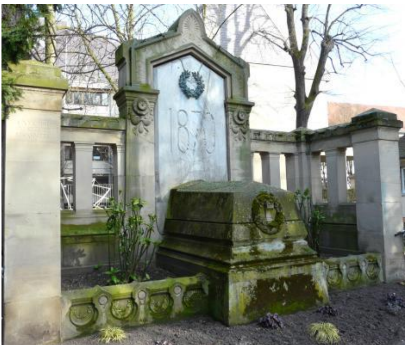
Monument aux morts de Strasbourg, 1874, jardin de l'école des arts décoratifs.