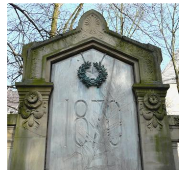
Détails du monument