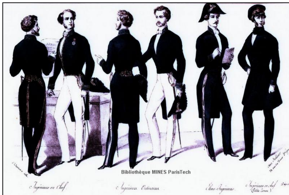
Figure 1 : Uniformes des ingénieurs des mines selon leur grade, Second Empire.

Il est curieux de constater l'ampleur numérique des archives concernant la Moselle par rapport aux autres départements de l'arrondissement. Son importante activité industrielle ne saurait expliquer à elle seule cette forte représentation.