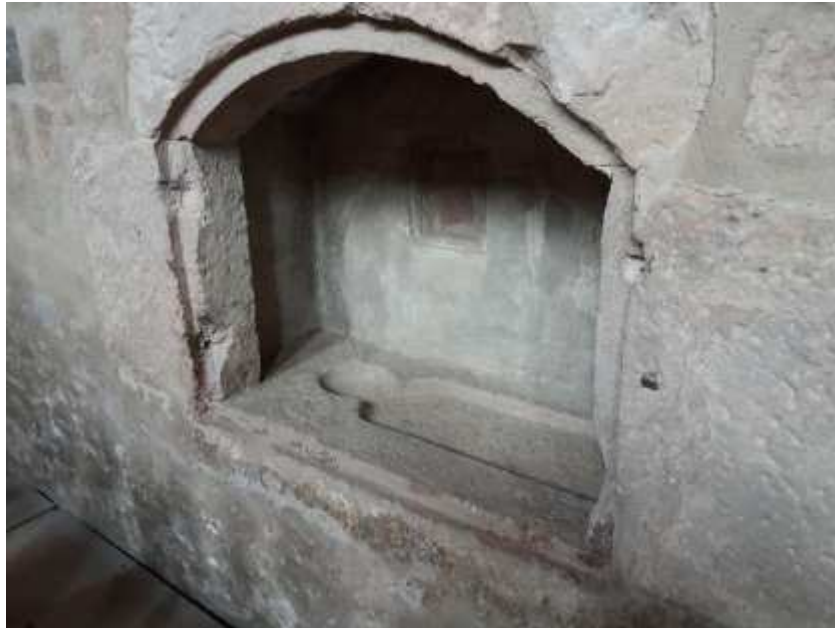
Enfeu du Saint Sépulcre monumental de l'Eglise Sainte-Walburge, 2021

- à l'église Sainte-Walburge à Walbourg – Seconde moitié du XV e siècle. Seul l'enfeu* subsiste aujourd'hui.