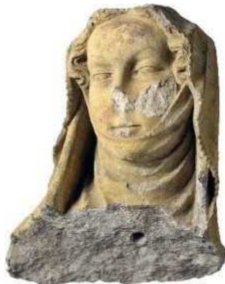
Tête de femme, fragment du Saint Sépulchre monumental de la Commanderie Saint-Jean de Jérusalem de Strasbourg

- à la commanderie de Saint-Jean de Jérusalem de Strasbourg, dont il ne reste que quelques fragments conservés au Musée de l'Œuvre Notre-Dame – 1398-1400