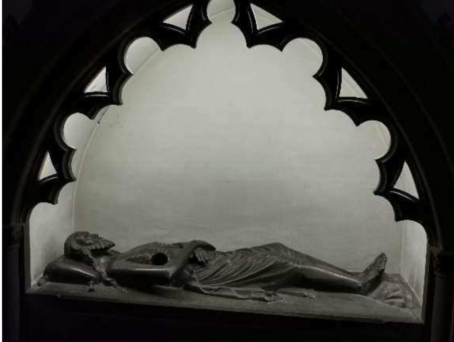
Saint Sépulcre monumental de l'Eglise Notre-Dame de la Nativité de Saverne, 2020

- à l'église Notre-Dame de la Nativité de Saverne, dont il ne reste qu'un fragment – vers 1400. Le fragment se trouve contre la paroi nord de la nef, à proximité du chœur.