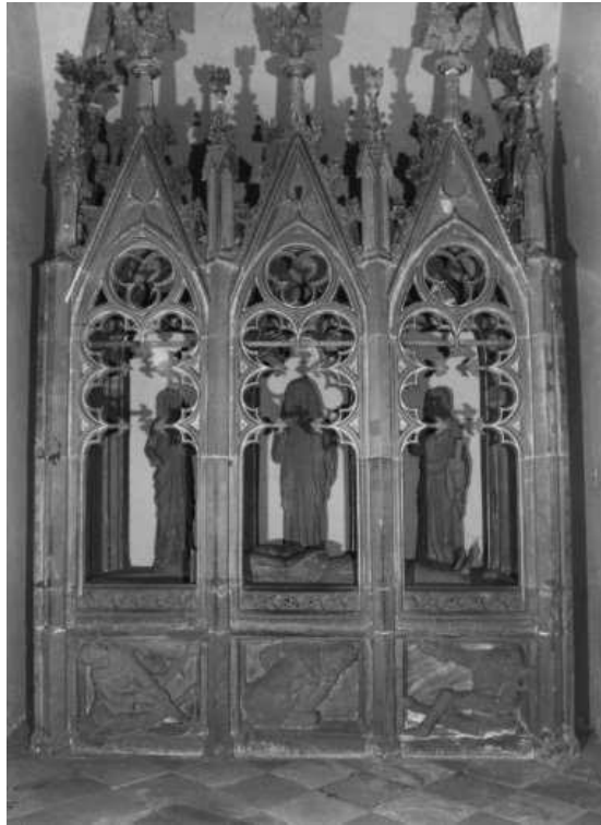
Saint sépulcre monumental de l'église Saint-Nicolas de Haguenau, 1985

- à l'église Saint-Nicolas de Haguenau - Milieu du XIV e siècle. Le monument se trouve actuellement dans la chapelle du SaintSépulcre.