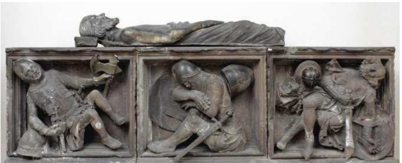
Gisant et gardiens, fragments du Saint Sépulcre monumental de la chapelle Sainte-Catherine

- à la chapelle Sainte-Catherine et la cathédrale Notre-Dame de Strasbourg – Entre 1340 et 1345, probablement avant 1343. Les fragments sont conservés en partie au Musée de l'œuvre Notre-Dame et dans le Service d'architecture de l'œuvre Notre-Dame.