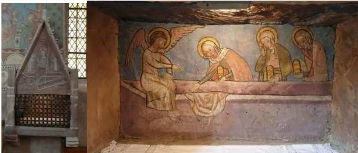
Armoire liturgique du Saint Sépulcre monumental de l'Eglise de l'Assomption de la Vierge de Rosenwiller et intérieur de l'armoire liturgique, 2020

- Armoire liturgique supposée à figures mobiles à l'église de l'Assomption de la Vierge de Rosenwiller– Fin XIV e ou début XV e siècle.