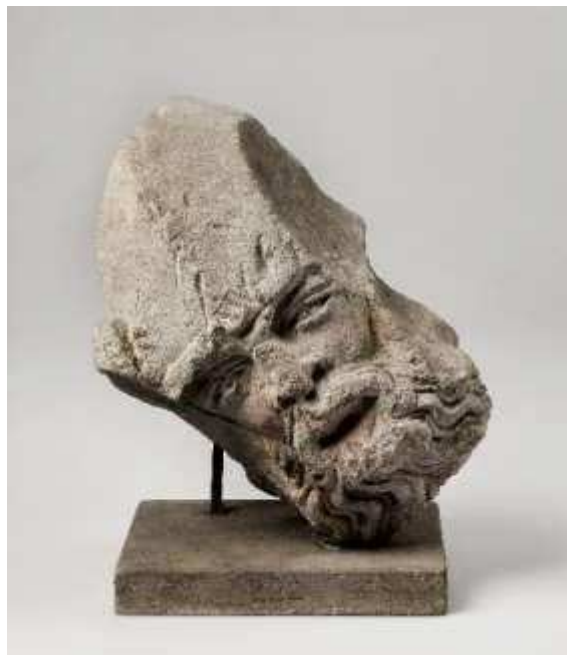
Tête de gardien trouvée rue du Vieux-Marché-aux-Vins mais on ignore de quel saint-sépulcre elle provient.

- rue du Vieux-Marché-aux-Vins à Strasbourg, dont il ne reste qu'un fragment conservé au Musée de l'Œuvre Notre-Dame – Milieu ou seconde moitié du XIV e siècle.