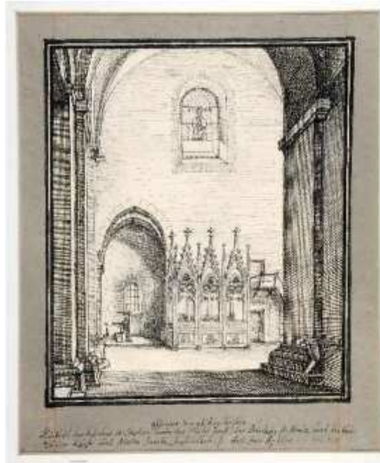
Arhardt : Intérieur de l'ancienne église conventuelle de St Etienne de Strasbourg représentant le Saint Sépulcre monumental

- à l'ancienne église conventuelle de Saint-Etienne de Strasbourg, actuellement disparu – milieu du XIV e siècle. Le saint sépulcre n'est connu que par un dessin de Jean-Jacques Arhardt daté de 1670 conservé au Cabinet des Estampes de Strasbourg