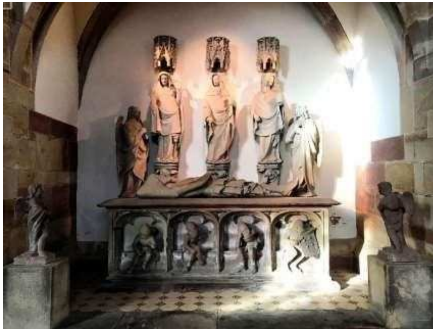
Saint sépulcre monumental de l'église Saint-Florent de Niederhaslach, 2020

- à l'église Saint-Florent de Niederhaslach – fin du XIV e siècle. Le monument se trouve dans la seconde chapelle centrale dans la chapelle Notre-Dame.