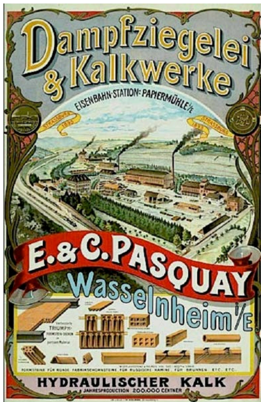
Document 3. - Affiche publicitaire des établissements Pasquay à Wasselonne, 1895, ADBR 57 J 475 (également conservé en 6 Ph 16).